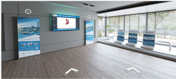
Beispiel einer 3D, 360 Grad virtuellen Tour

Wir bringen Ihre Planung in die nächste Dimension – interaktiv, anschaulich und überzeugend.