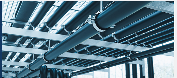
3D-Rendering in einer Anlagenplanung